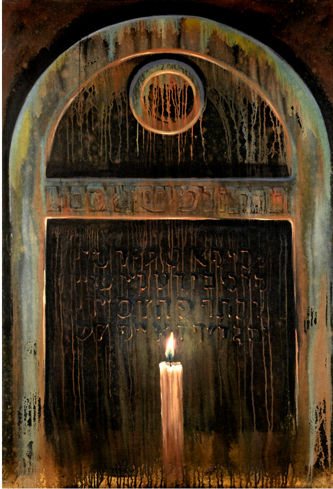
Menschenabwesend Absence des hommes 1998