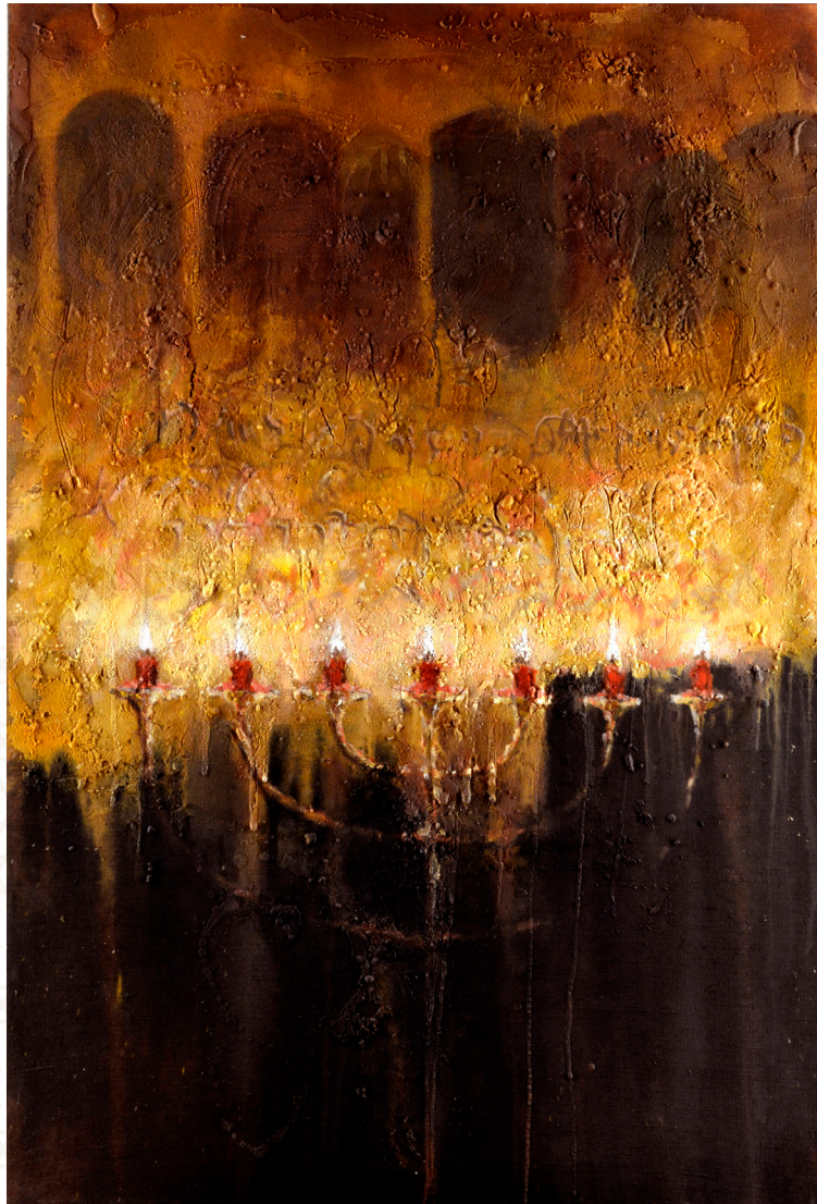
Menschenvergebung Pardon des hommes 1997

Marqué à tout jamais par le rôle de son pays natal dans l'histoire de l'Humanité, Winfried Veit souhaite plus que tout que l'on considère ses tableaux comme un hommage respectueux à ceux qui ont tant souffert.